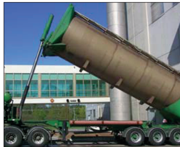
Entleeren von Silofahrzeugen