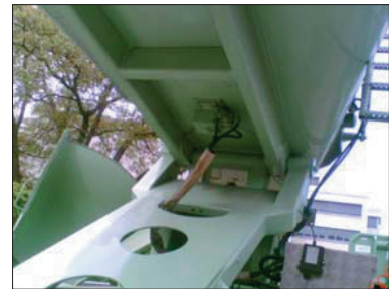
NHG 900 L