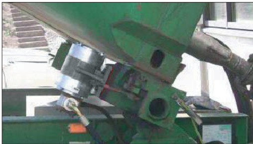
NHG 3000 L