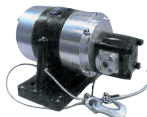
NHG 3000 L